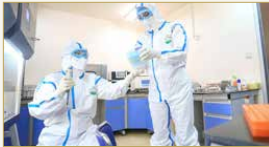
العلماء يسابقون الزمن لإيجاد لقاح كورونا

يبدو أن التوصل إلى لقاح فيروس كورونا المستجد بات قريباً، حيث يتوقع أن تبدأ التجارب على البشر في الولايات المتحدة في وقت أبكر كثيراً مما كان متوقفاً. وقامت شركة "موديرنا" للصناعات الدوائية بشحن أول دفعة من لقاح محتمل للبشر المضامين بفيروس كورونا الجديد، حيث تم تزويدها للباحثين الحكوميين بهدف إجراء الاختبارات على البشر، وذلك بعد 3 أشهر فقط من ظهور الفيروس وتحليل تسلسله الجينومي. ويعد يوم على إعلان الشركة أنها أرسلت اللقاح المحتمل للفيروس إلى المعهد الوطني للحساسية والأمراض المعدية لاختباره في الولايات المتحدة، ارتفعت أسهم الشركة بشكل صاروخي في وقت مبكر من يوم الثلاثاء، ويأتي هذا الخبر في وقت ارتفع فيه عدد الإصابات بالفيروس، الذي أخذ ينشئ في الصين في البداية أواخر العام الماضي، في مختلف أنحاء العالم إلى نحو 81 ألف إصابة، بينما ارتفع عدد الوفيات إلى أكثر من 2760 حالة، غالبيتها في الصين. وكانت شركة الصناعات الدوائية "موديرنا" عقدت شراكة مع المعاهد الوطنية للصحة لتطوير لقاح لفيروس كورونا الجديد، تم تصميمه لاستهداف البروتين، الذي يكون على شكل "سنبلة" على سطح الفيروس ويسمح له بغزو الخلايا البشرية