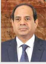
عبد الفتاح السيسي

♦ أشاد بما قدمه الرئيس الراحل للأمة كأحد قادة وأبطال حرب أكتوبر