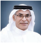
المستشار أسامة العصفور.

أكد المستشار أسامة العصفور، الأمين العام لمجلس الشورى، أن الأمانة العامة للمجلس وضعت خطة احترازية وتوعوية لمتابعة الامانة العامة من أجل التعامل مع فيروس كورونا (كوفيد ١٩)، وذلك بناء على توجيهات علي بن صالح الصالح، رئيس المجلس، وحرصاً على سلامة الموظفين والإطمئنان على الصحة والسلامة بالأمانة العامة.