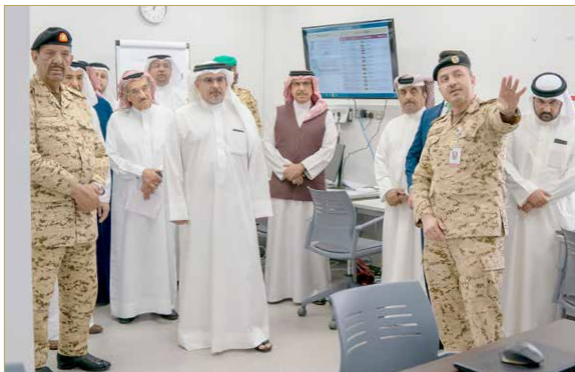
سمو ولي العهد لدى زيارته غرفة العمليات التابعة للفرق الوطني للتصدي لفيروس كورونا (كوفيد 19)

سمو ولي العهد: مواجهة "كورونا" تتطلب تضافر الجهود من الجميع