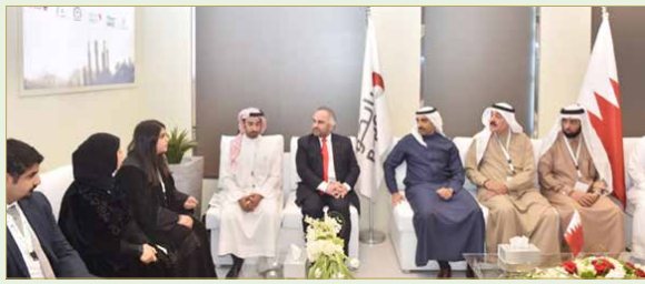
لقاء الشيخ محمد بن خليفة بعدد من الشركات النفطية

تحويل الموارد الطبيعية لغاز منتج للطاقة والمواد الكيماوية