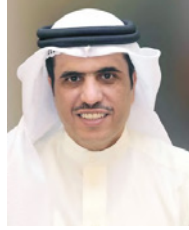
وزير شؤون الإعلام

وجه وزير شؤون الإعلام علي الميحي، تحية إجلال وتقدير للكفاءات الوطنية الطبية المحترفة التي تباشر على مدار الساعة للكشف على كافة المسافرين القادمين من الدول الموبوءة بفيروس كورونا (كوفيد 19) فور وصولهم إلى البحرين عبر مختلف المنافذ وأشد بالتعاون المواطنين والمقيمين على أرض المملكة الذين اجتمعت قلوبهم على حب البحرين، في مشهد يعكس وعياً عالياً وروحاً وطنية جبيل عليها شعب البحرين حفاظاً على أمن المملكة وسلامتها أهلها. وشدد وزير شؤون الإعلام على أن المتابعة الشخصية لصاحب السمو الملكي الأمير سلمان بن حمد آل خليفة ولي العهد نائب القائد الأعلى النائب الأول لرئيس مجلس الوزراء على مدار الساعة