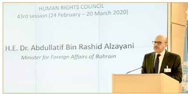
وزير الخارجية يلقي كلمة مملكة البحرين في مجلس حقوق الإنسان

الزياني: جلالة الملك أظهر شجاعة فريدة في قبول نتائج لجنة تقصي الحقائق