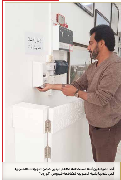
أحد الموظفين أثناء استخدامه معقم اليدين ضمن الاجراءات الاحترازية التي نفذتها بلدية الجنوبية لمكافحة فيروس "كورونا"

قال رئيس قسم الخدمات الهندسية والصيانة بإدارة الأوقاف السنوية عبدالله راشد إن المقابر تعد من أغنى الوقفيات، التي تتميز بربيعها العالي ومصاريفها المنخفضة. ولفت لدى حضوره اجتماع مجلس بلدي الجنوبية لمناقشة طلبات المجلس البلدي المتعلقة بإدارة الأوقاف السنوية، إلى أنه يجري العمل على التعاقد السنوي مع شركات تتولى مهام تنظيف المقابر لاسيما مع توافر الميزانيات وكثرة الشكاوى المتعلقة بمستوى نظافة المقابر. وذكر أن الإدارة تعمل على افتتاح 4 صالات مناسبات "فخمة" خلال العام الجاري، تتلاءم في تصميماتها مع ثقافة وطبيعة المنطقة التي تقع فيها. وبين أن الصالات التي تعمل الإدارة