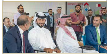
سمو الشيخ ناصر بن حمد لدى زيارته بنك "إلى"

المنامة - بنا زار سموه جلا ملة الملك للأعمال الخيرية وشؤون الشباب، مستشار الأمن الوطني رئيس مجلس الأعلى للشباب والرياضة سمو الشيخ ناصر بن حمد آل خليفة بنك "إلى" البحرين، بنك التجزئة التابع لبنك ABC، وبهذه المناسبة، أشاد سمو الشيخ ناصر بن حمد آل خليفة بفكرة بنك "إلى" القائمة أساساً على تجربة عصرية قادرة على معالجة التحديات المالية عبر استخدام التكنولوجيا والهواتف الذكية وتسخيرها بصورة مثالية لتسهيل الإجراءات البنكية والمصرفية. (04)